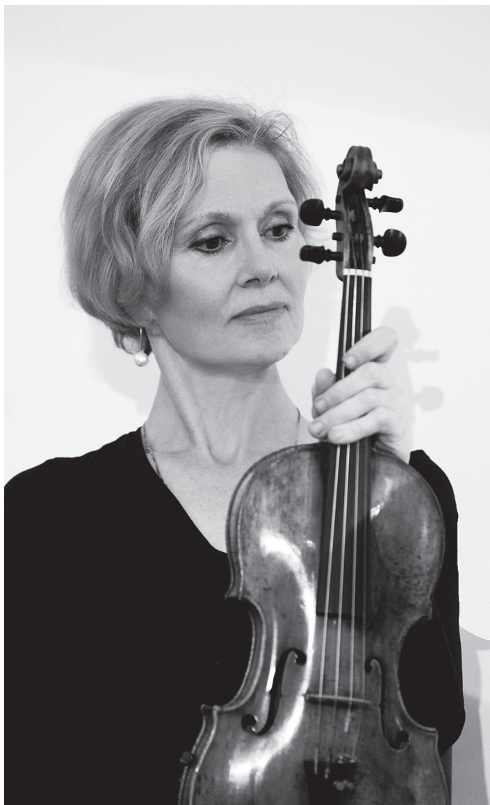
Татьяна Тихоновна Гринденко, народная артистка России.