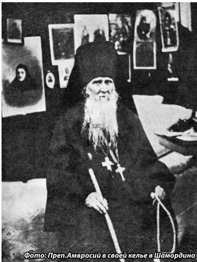
Фото: Преп. Амвросий в своей келье в Шамордино