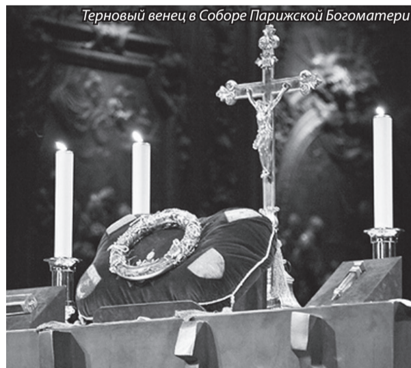
Терновый венец в Соборе Парижской Богоматери