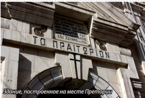
Здание, построенное на месте Претории