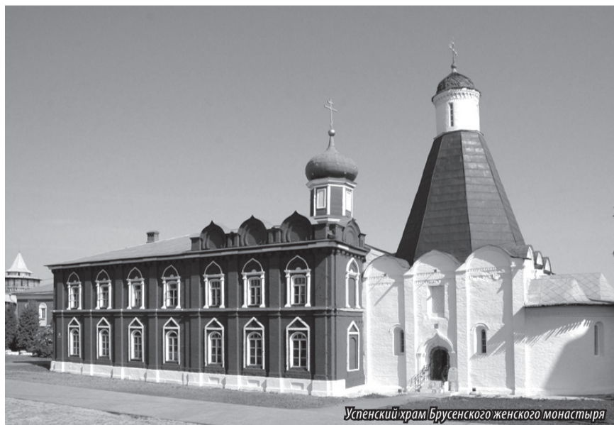
Успенский храм Брусенского женского монастыря

Особой радостью этот праздник отмечен для насельниц обители и прихожан, он начался Божественной Литургией, водосвятным молебном, продолжился Крестным ходом, и завершился поздравлениями и праздничной трапезой.