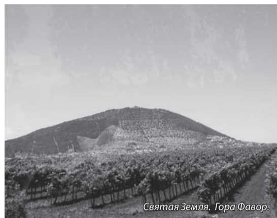
Святая Земля. Гора Фавор.