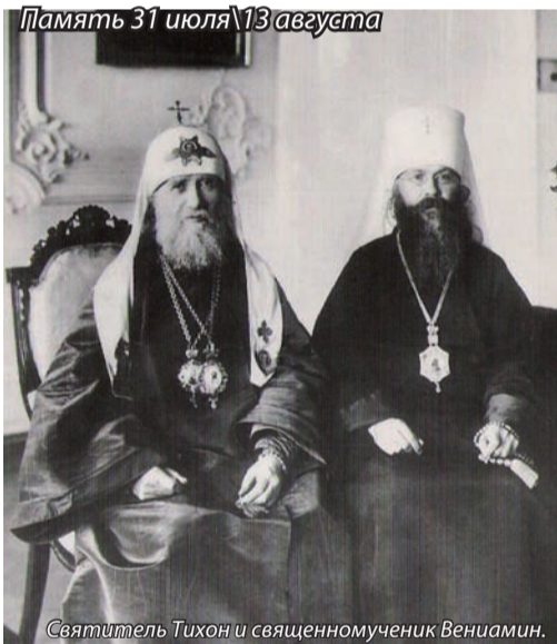
Святитель Тихон и священномученик Вениамин.

Рукоположенный во епископа Гдовского в 1910 г., Владыка Вениамин воспринял святительский сан, как обязанность пастырского подвига и апостольской проповеди. Его часто видели в самых отдаленных и бедных кварталах столицы, куда он спешил по первому зову, словно приходской священник, в простой рясе, без внешних отличий епископского сана, и где крестил ребенка или напутствовал умирающего. Немало труда приложил он к спасению падших женщин, выступая с проповедями в «Обществе Пресвятой Богородицы». Он всегда находил путь к сердцам простых людей, за что был искренне любим паствой, называвшей его «наш батюшка Вениамин». Евангельская простота святителя, отзывчивость, сердечность, доступность в сочетании с открытым лицом, тихим, проникновенным голосом и всё освещавшей улыбкой, располагали к нему даже иноверцев.