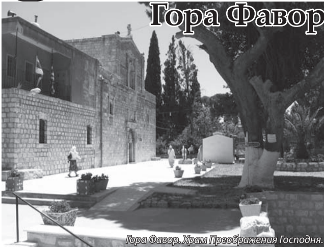
Гора Фавор. Храм Преображения Господня.

Святая гора Фавор имела глубочайшее значение в библейской истории. Во времена Ветхого Завета она служила границей между землями колена Забулона на западе,