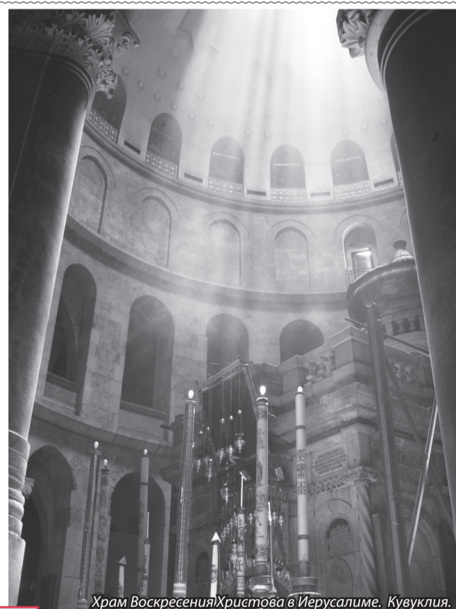
Храм Воскресения Христова в Иерусалиме. Кувуклия.

Прот. Георгий Флоровский. «Воскресение мертвых».