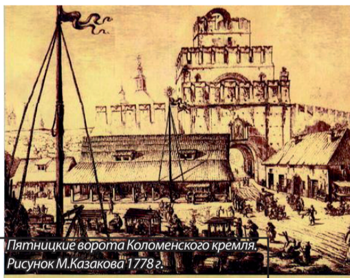
Пятницкие ворота Коломенского кремля. Рисунок М.Казакова 1778 г.

«Это ли не благословенная страна? Здесь, несомненно, христианская вера соблюдается в полной чистоте... Многая лета им! О, как они счастливы!»