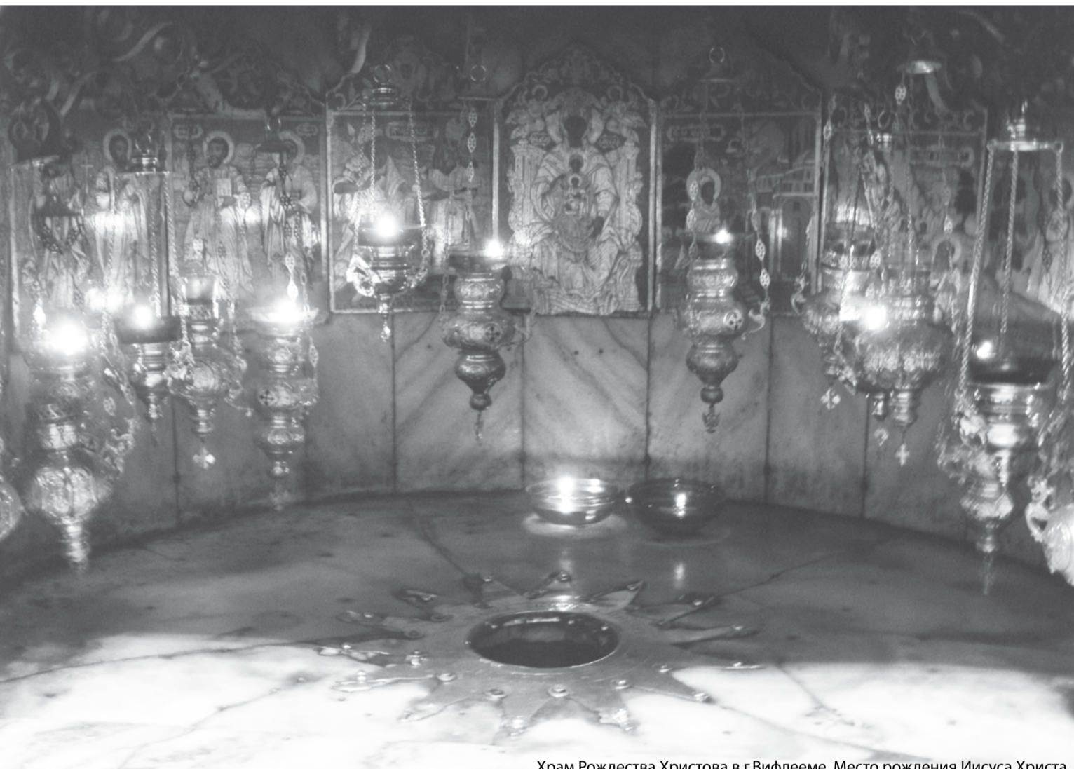
Храм Рождества Христова в г.Вифлееме. Место рождения Иисуса Христа